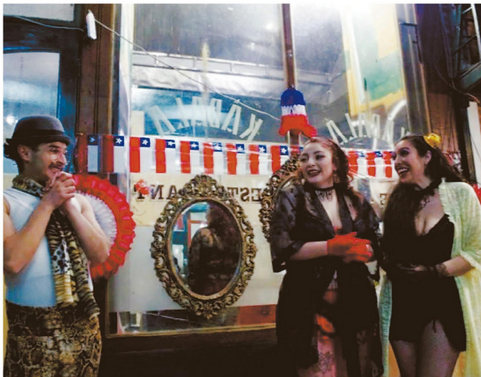
EL TRABAJO EN EL RUBRO ARTÍSTICO SE CARACTERIZA POR SU INTERMITENCIA Y LA ESCASEZ DE VÍNCULOS LABORALES FORMALES.

“En mi caso particular, cotizaciones no tengo. O sea, mañana, pasado, llega la hora de jubilar, y si sigo con esta vida de trabajar en el arte, ganando para el día a día, yo no voy a tener jubilación. (...) Al final, he ahí la frase: voy a hacerlo aunque sea por el amor al arte. La precariedad en el arte tiene muchos flancos