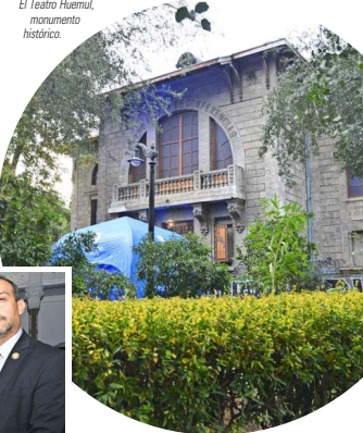
El Teatro Huemul, monumento hist3rico.