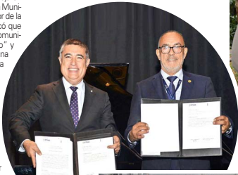
Firma de convenio entre Universidad Bernardo O'Higgins y Municipalidad de Santiago.