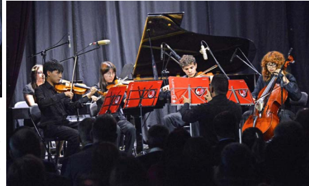
Presentaci3n de la Orquesta de la Academia de Formaci3n Musical de Santiago.