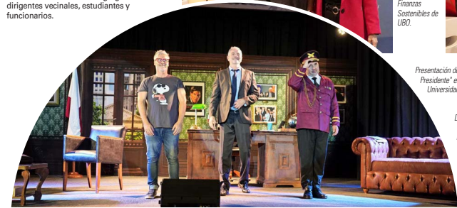
Presentaci3n de la obra "El Guionista del Presidente" en el Teatro de la Universidad Bernardo O'Higgins.