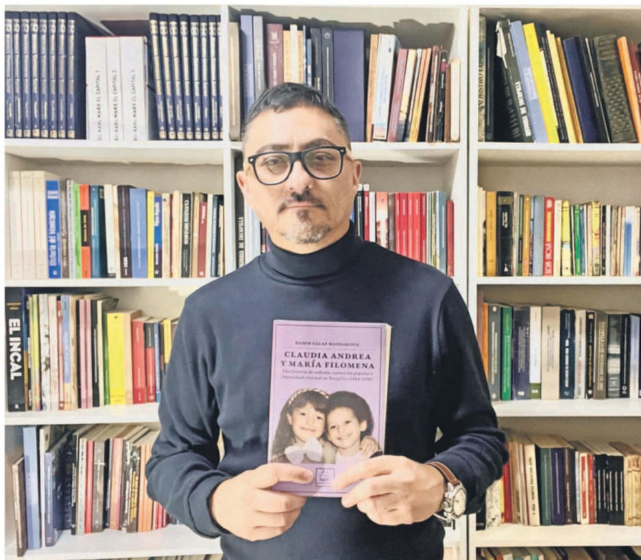
EL INVESTIGADOR TOCOPILLANO QUE EN LAS LÍNEAS DE ESTE LIBRO QUIERE ENTREGAR JUSTICIA A QUIENES SIEMPRE LES FUE NEGADA.