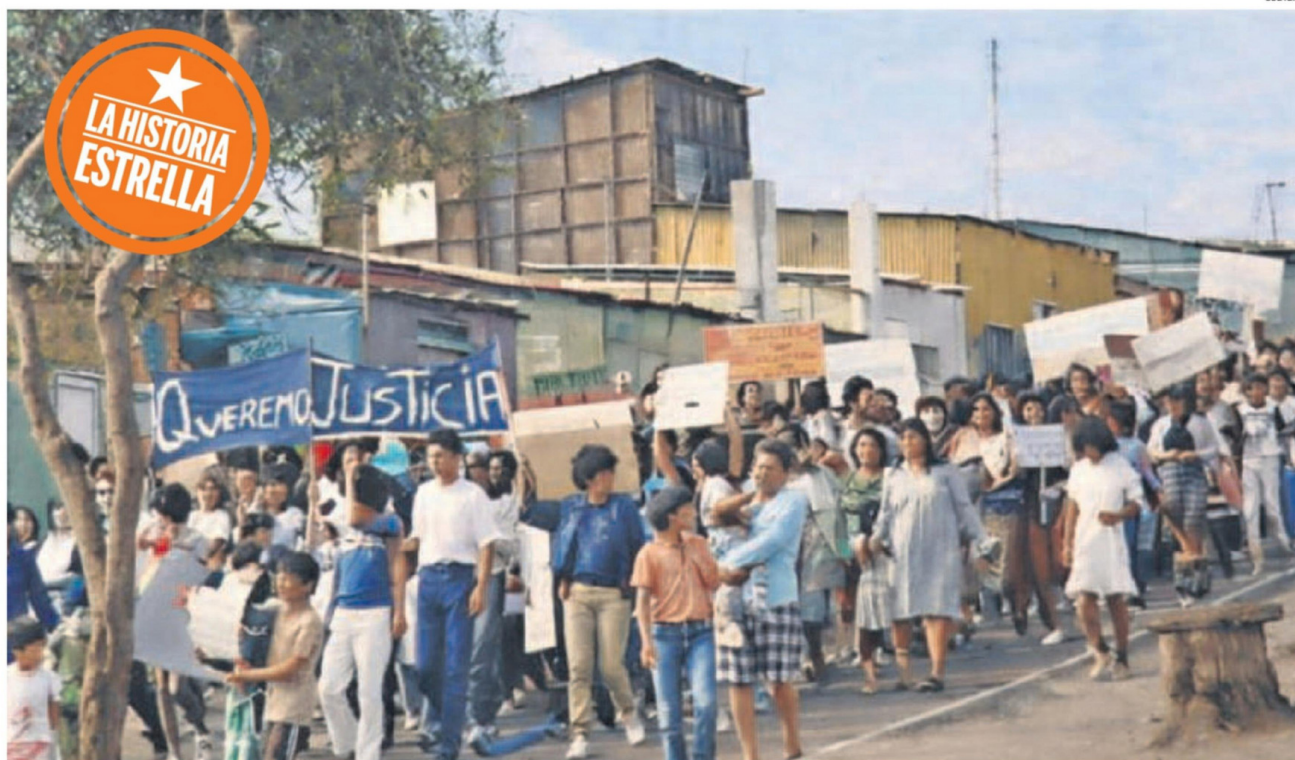
EL DRAMÁTICO HECHO MOVILIZÓ A LA COMUNIDAD TOCOPILLANA.