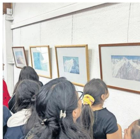
Niños de múltiples colegios de Lota fueron parte del lanzamiento.

La artista afirmó que durante los años realizó pinturas de variadas temáticas, pero la constante siempre fue el paisaje. Dentro de