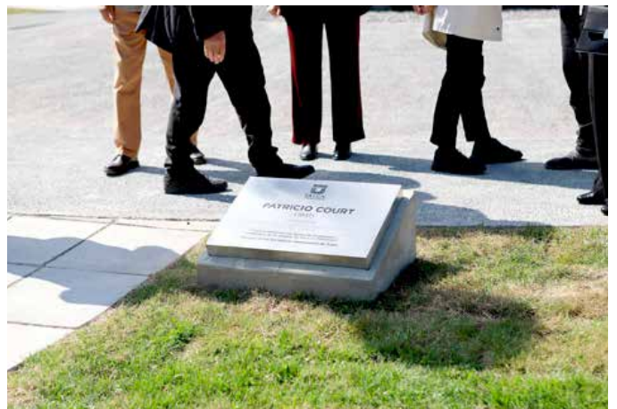
Frente a la estructura, se ubicó la placa que lleva el nombre del autor para recordar en la posteridad dicho momento de inauguración.