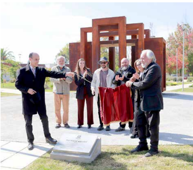
El momento de descubrir la placa fue compartido por el rector de la casa de estudios y el autor de la escultura entre los aplausos de la comunidad.