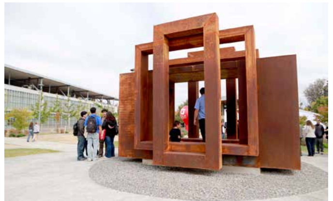
La estructura fusiona la arquitectura y la escultura para brindar un espacio único.