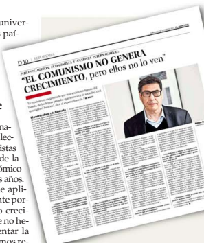
El domingo, Reportajes de "El Mercurio" entrevistó al académico francés y se recordaba que podía ganar el Nobel.